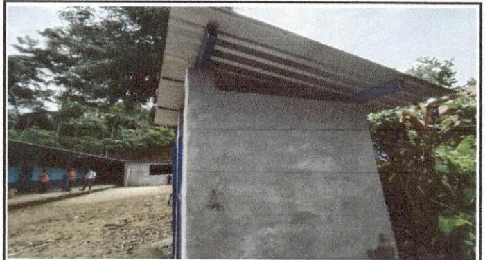
Foto 2: SUSTICIÓN DE LAMINA POR LAMINA TROQUELADA, REPELLO MURO, SUSTITUCIÓN DE ELEMENTOS DE FIJACION , SUSTITUCIÓN DE ESTRUCTUTRA DE SOPORTE DE MADERA POR METAL